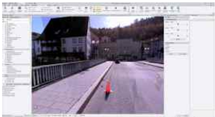
Laserscan mit Standortdarstellung

Beim Bauen in bestehenden Strukturen lassen sich wesentlich mehr Details darstellen und in einer späteren Planung berücksichtigen. Dies betrifft nicht nur die Detaillierung von Gebäuden und Oberflächen sondern auch die Schadensdokumentation vor und nach einer Baumaßnahme. Ebenso können umliegende Gebäude und Geländeformen in einer geometrischen Realität dargestellt werden. Mit keinem anderen Werkzeug lässt sich die Geometrie von Oberflächen so präzise erfassen wie mit Laserscannern.