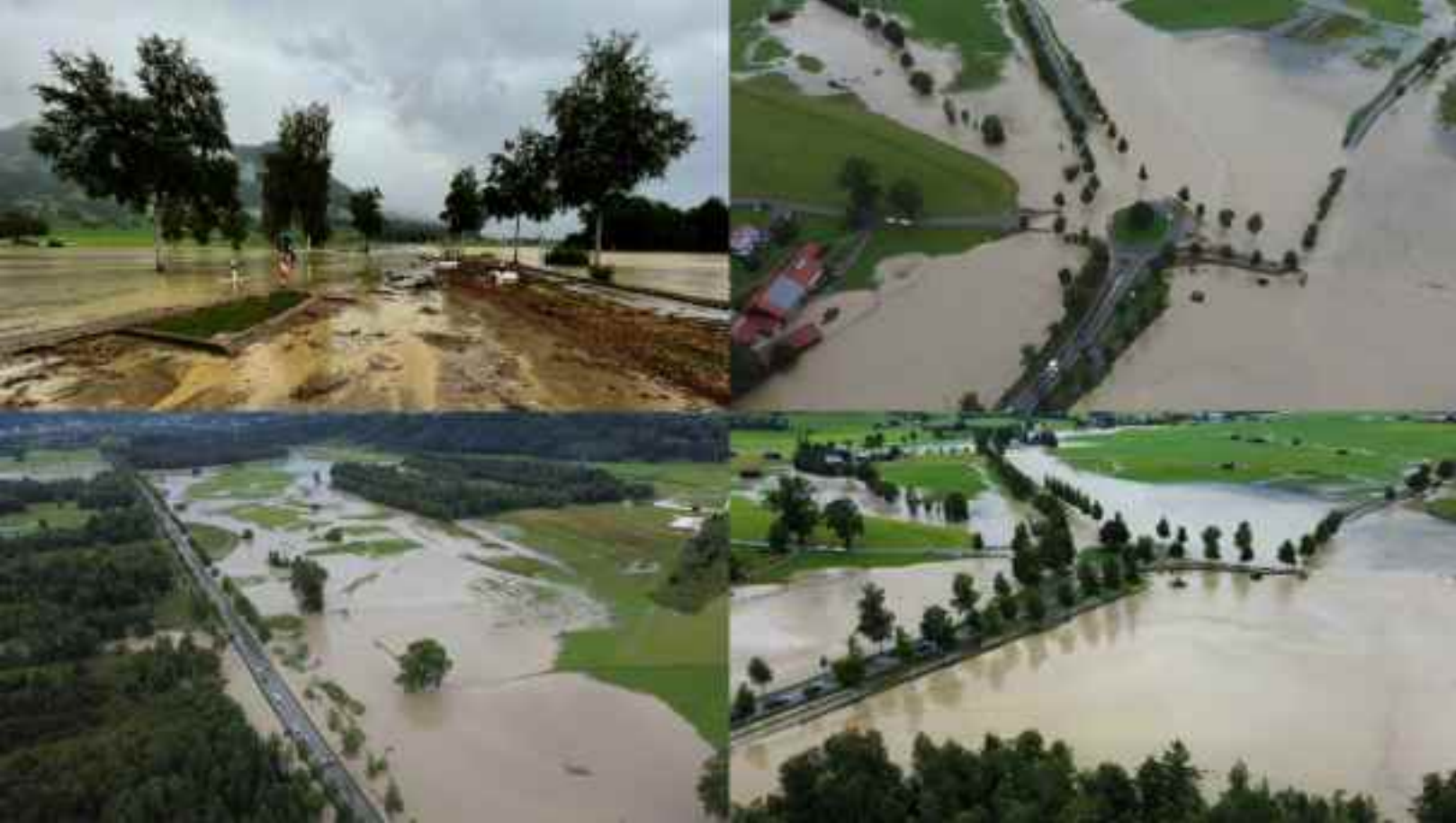
Bilder vom Pfingsthochwasser 1999, Bereich Seifen